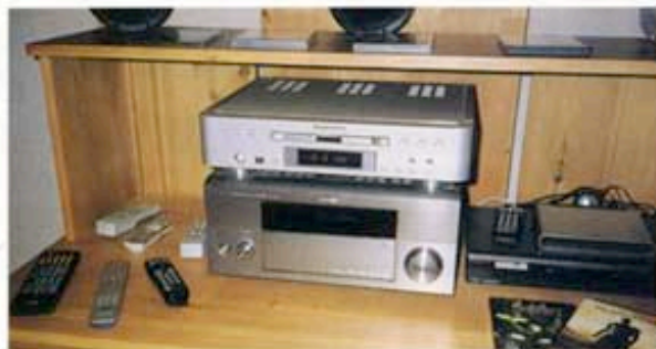
A gauche La source universelle Marantz DV 12SE, posée sur l'amplificateur audio-vidéo Yamaha DSP-AZ9.