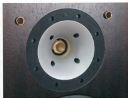
带有相位锥和小号角的高音

过人之处是它高达93dB的灵敏度，十分易于驱动。和不少法国音箱一样，高效率也是Triangle的特色。我用Mark Levison 383驱动丹拿C2时，有时会有些力不从心（重播大型交响乐时），但换上Volante 260则生龙活虎，收发自如。Volante 260的用户可以随心所欲的搭配小功率功放，这也是非常让人羡慕的。