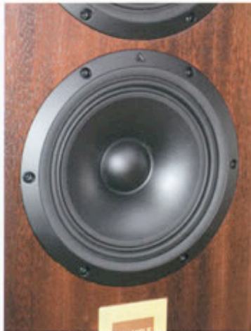
S型双折环低音单元