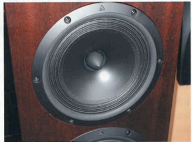
宽频带的中音单元

在聆听过 Magellan (麦哲伦) 音箱之后,我就估计 Triangle 要推出一对设计上与之相似的“缩水版”,果不其然, Triangle 推出了小旗舰“麦哲伦协奏曲”;如果你还嫌太贵,那么与小旗舰最接近的就是这对 Volante 260 音箱了,它所采用的先进单元和精细做工都表明了它是 Triangle 的中坚实力产品,这样的音箱确实值得一试。■