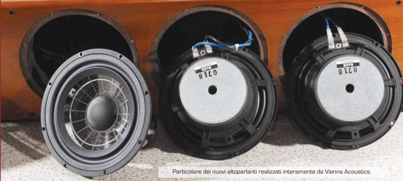
Particolare dei nuovi altoparlanti realizzati interamente da Vienna Acoustics.

VIENNA ACOUSTICS BEETHOVEN CONCERT GRAND