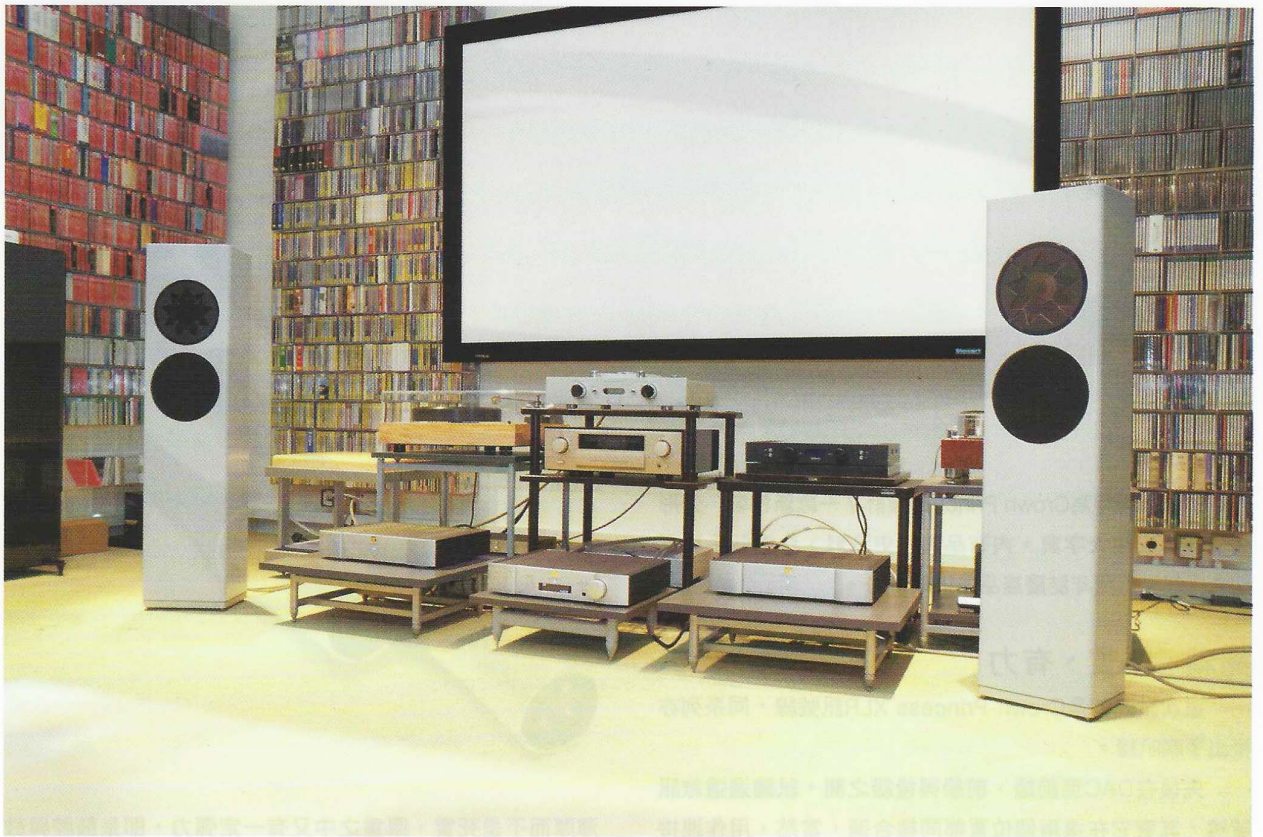
▲ 位於美國加州的丹佛市，製音廠——Siltech

導體以外，品牌亦於電介質及線身結構上進行研究。理論上，正、負導體以45度互相絞繞，可以有效地抵消雜訊，不過線材於使用時需要被屈曲，不但令結構移位，亦會令電介質離開導體，從而出現氣泡，影響傳導。