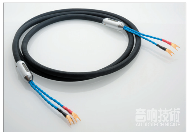
Siltech Crown Princess 平衡訊號線